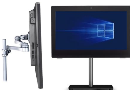
Bild rechts: Das Gerät lässt sich dann immer noch mit Hilfe einer aufgeklappten Büroklammer einschalten, die man durch ein unscheinbares Loch an der Geräteseite drückt.

Bild links: Der Einschalt-Button lässt sich deaktivieren, um unbefugtes Betätigen zu unterbinden. Hierzu öffnen Sie den PC und ziehen den entsprechenden Anschluss heraus (siehe Markierung).