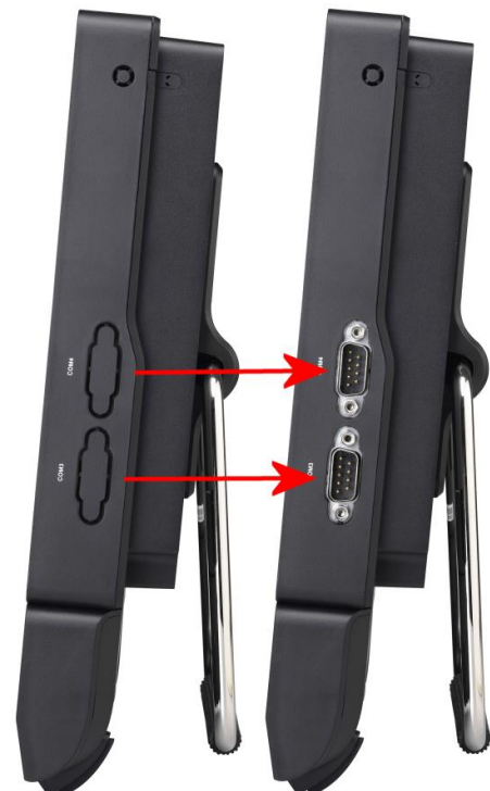
Shuttle XPC all-in-one P20U/P22U vor und nach dem Einbau von PCP21