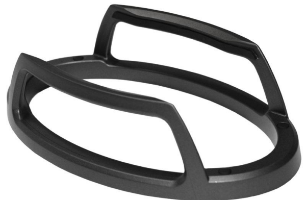
Vertikaler Standfuß PS01