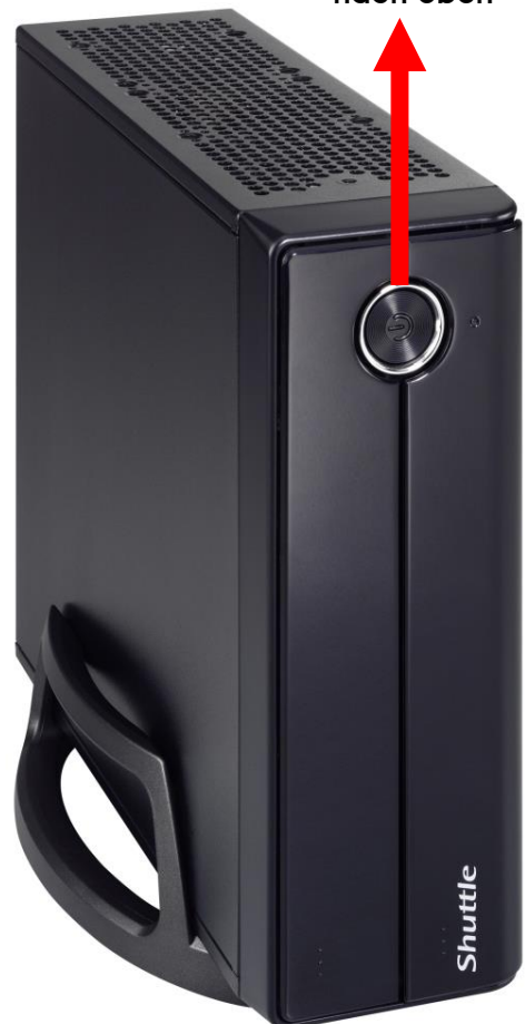
Shuttle 3L Slim-PC mit PS01